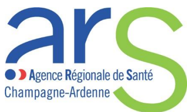
l'Agence Régionale de Santé Champagne-Ardenne