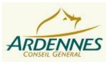
le Conseil Général des Ardennes